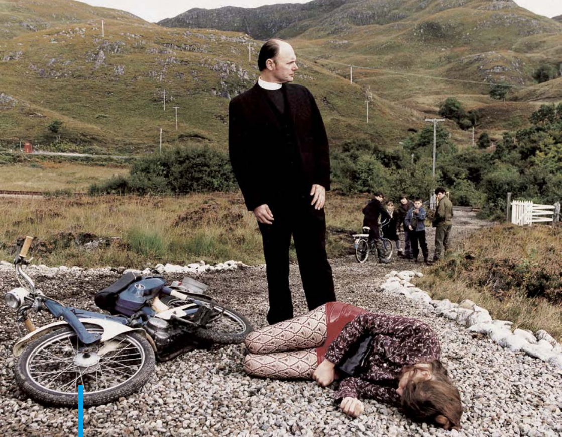
Breaking the waves (1996)