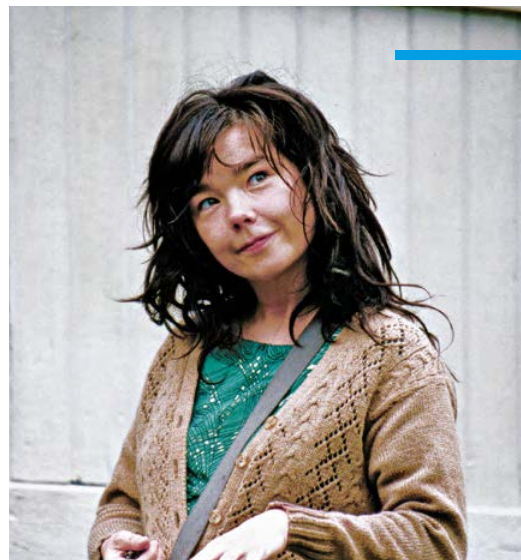
Dancer in the dark (2000)

☛ Cliquez ici pour télécharger les photos