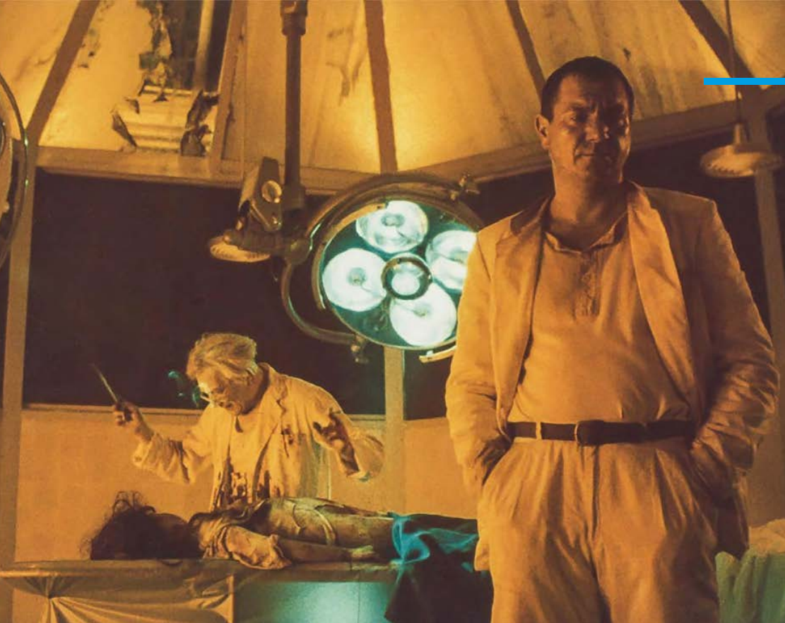
Element of crime (1984)