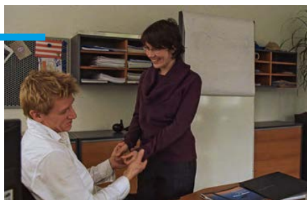
Le Direktør (2007)

Le propriétaire d'une société d'informatique décide de vendre son entreprise. Mais il y a un petit problème. A l'époque où il a créé sa société, il s'est inventé un directeur fictif derrière qui s'abrite pour prendre les décisions impopulaires. Comme les acheteurs potentiels insistent pour conclure le deal avec le directeur en personne, le propriétaire décide