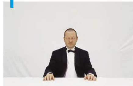
Five obstructions (2003)