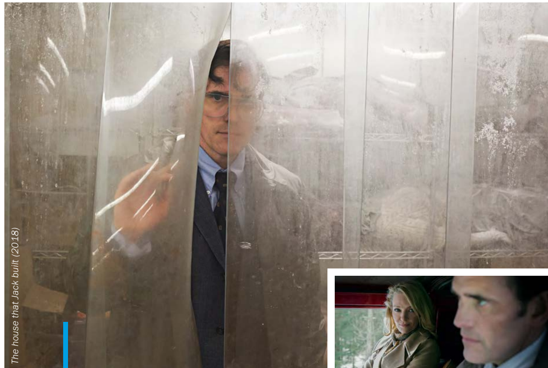
The house that Jack built (2018)